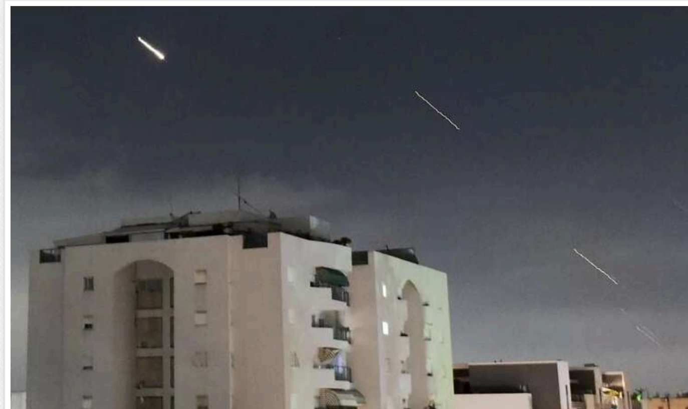
Сьогодні вночі Ізраїль планує завдати масштабного удару по Ірану

На підставі останніх даних, цієї ночі Іран очікує потужного удару з боку Ізраїлю.