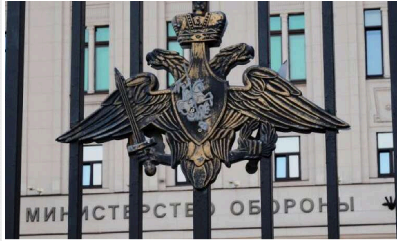
Стало відомо, яку суму пропонують жителям "ЛНР" за укладення контракту з МО РФ

Російські загарбники пропонують жителям захопленої Луганщини підписати контракт з Міністерством оборони РФ і вирушити воювати проти України за майже 3 мільйони рублів на рік.