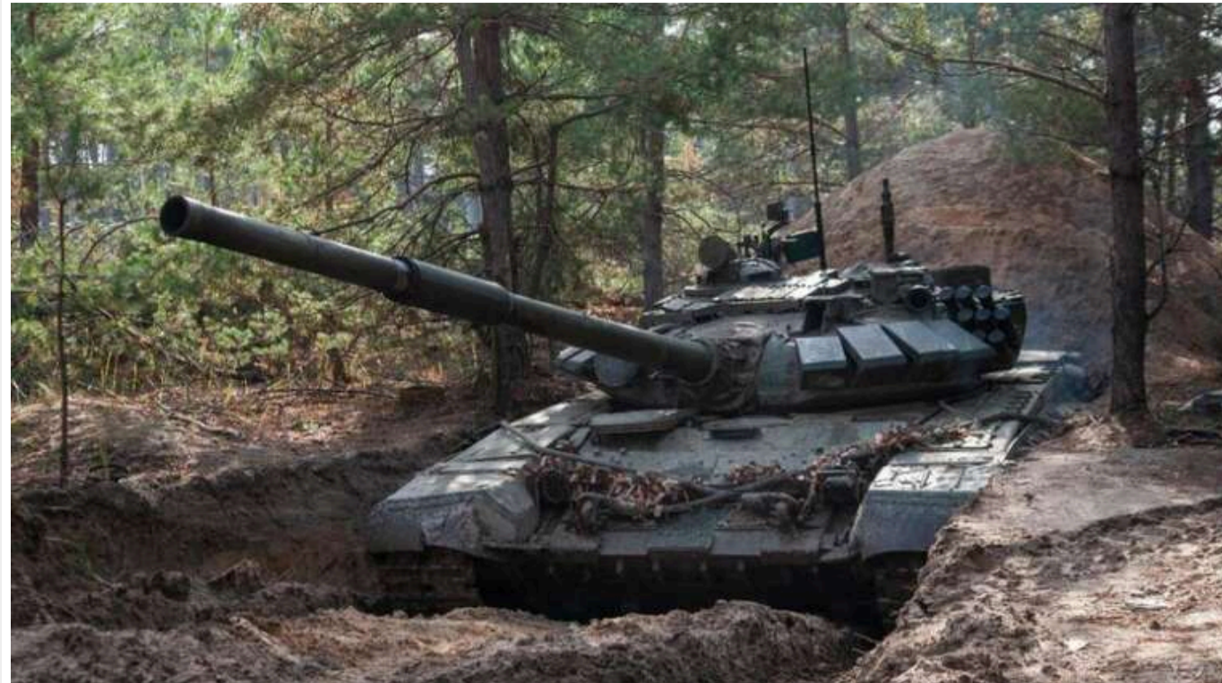
Майор ЗСУ пояснив, як зміниться положення на фронті в разі втрати Вугледару

Після захоплення Вугледара в Донецькій області армія РФ може спробувати просуватися далі, але значного успіху не досягне.