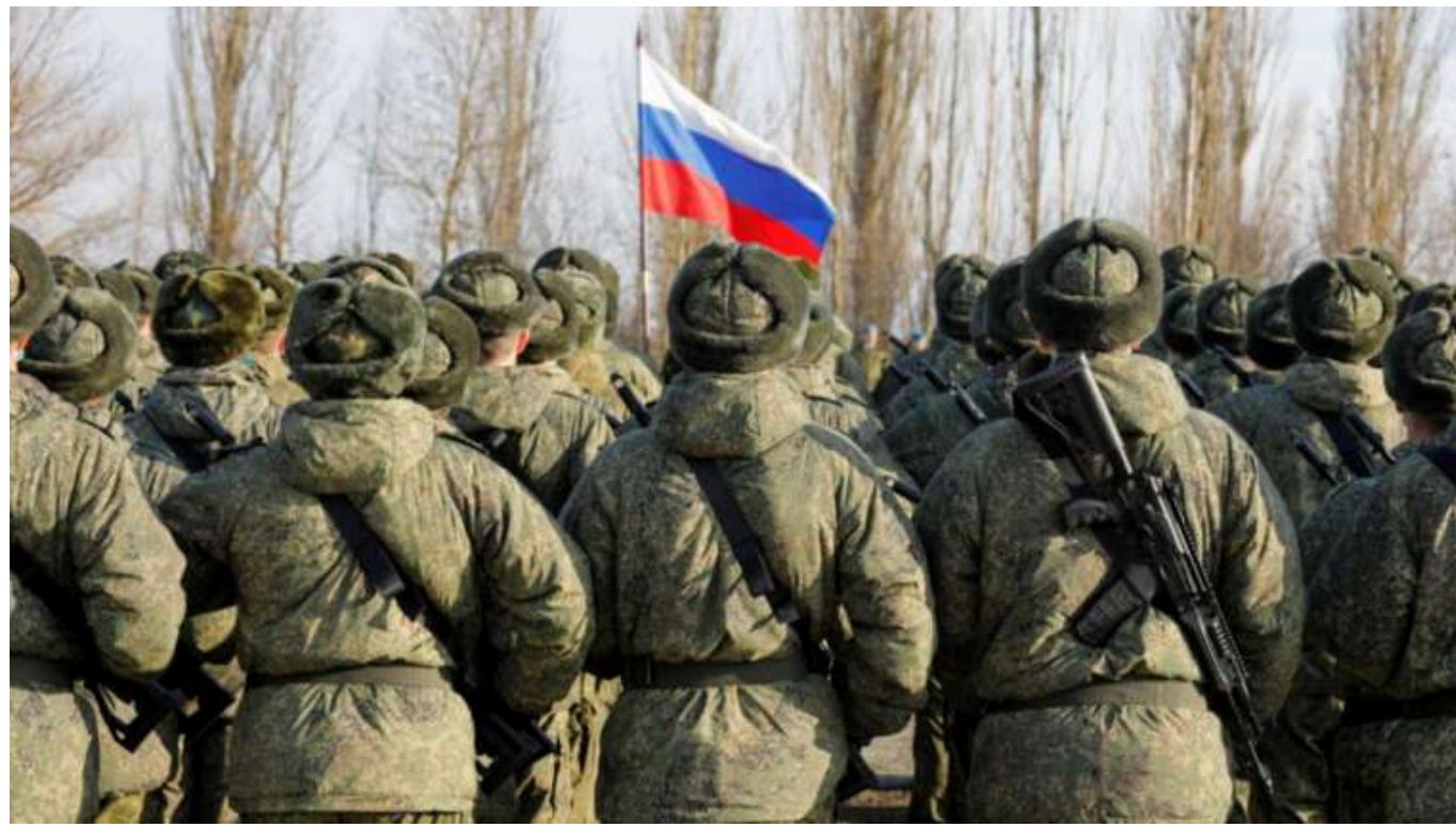
Боєць ЗСУ передбачає масштабну битву за Донбас

Після взяття Вугледара в Донецькій області для окупантів головним залишається Донбас, який вони всіляко будуть намагатися захопити.