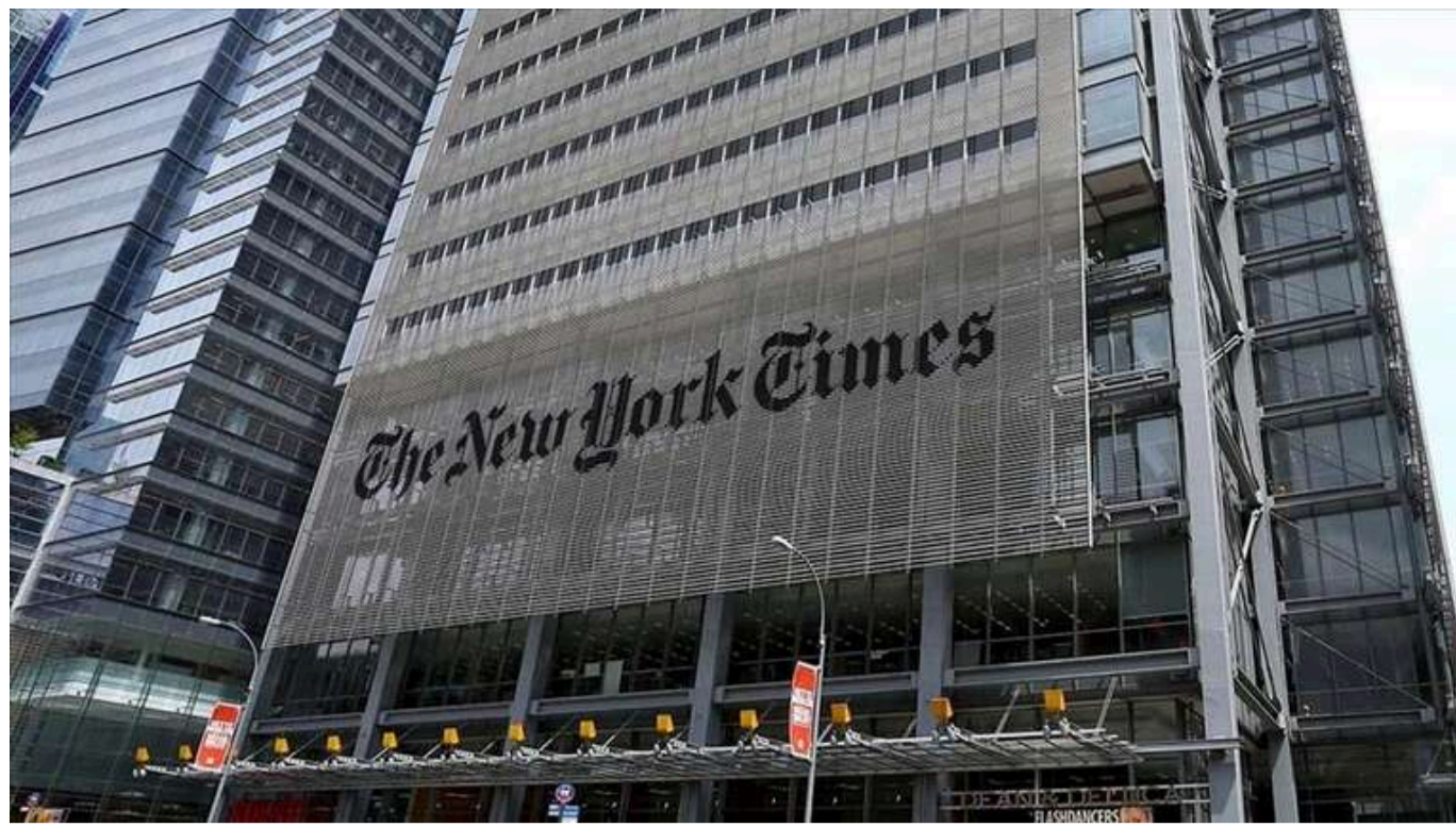
Видання New York Times висловило підтримку Камалі Гарріс на президентських виборах

У редакційній колонії NYT Гарріс називається «єдиним патріотичним вибором».