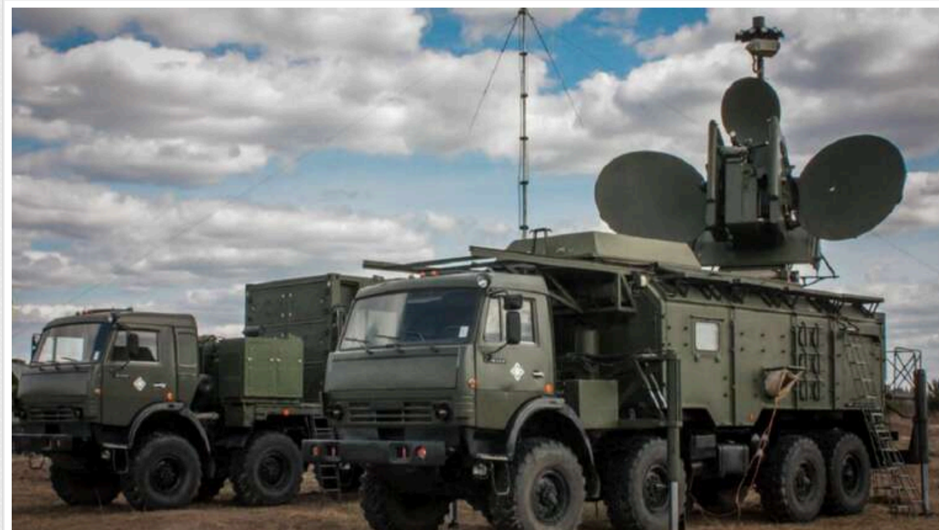
РЕБ Росії зменшила ефективність систем HIMARS більш ніж на 90%

Це питання обговорюється в статті в журналі The Atlantic, написаній двома американськими відставними військовими, які побували в Україні.