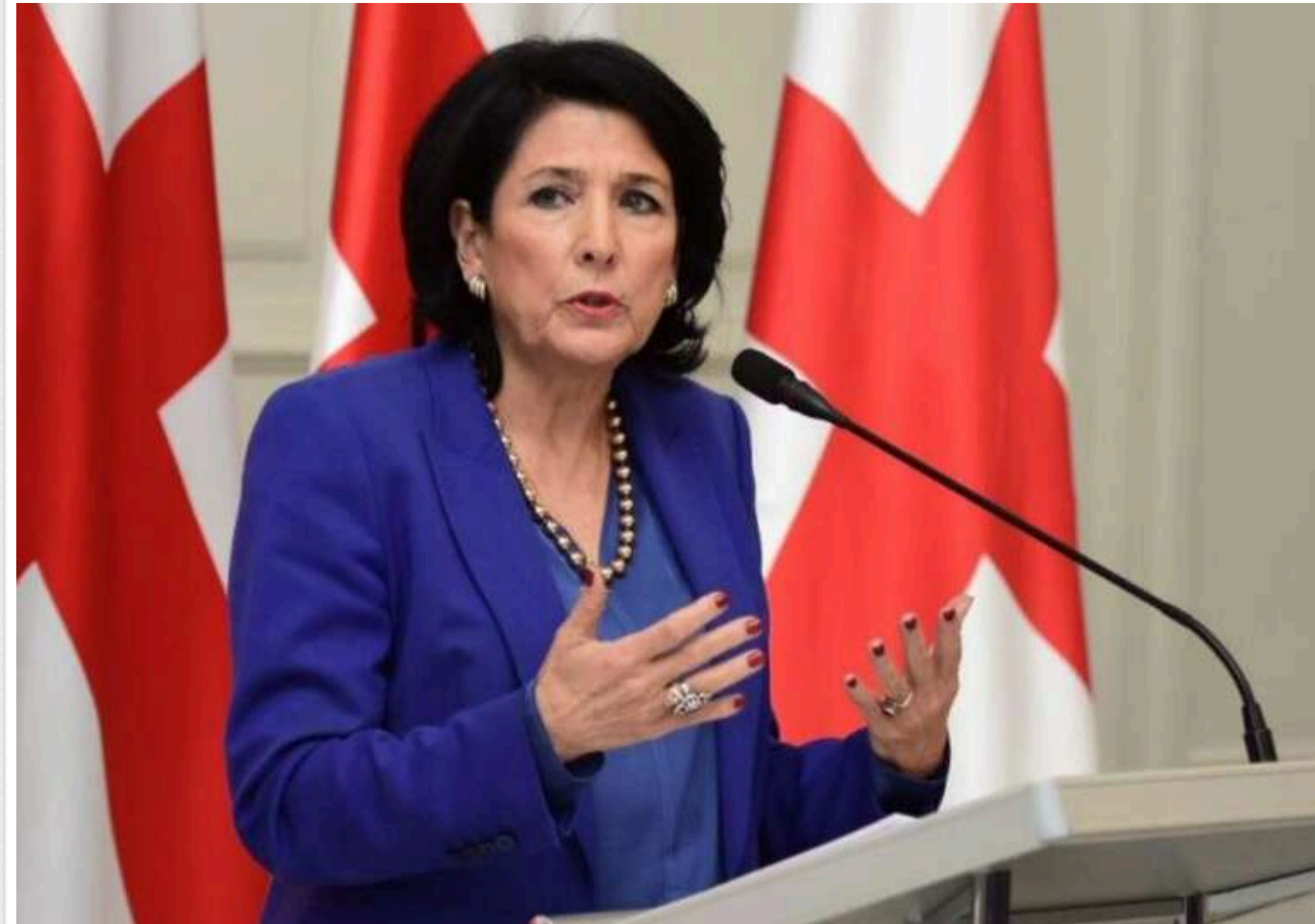
Президентка Грузії Зурабішвілі запропонувала опозиції сформувати тіньовий уряд без участі політиків

Президентка Грузії Саломе Зурабішвілі пропонує опозиції вже зараз розпочати процес формування "тіньового" технократичного уряду на випадок перемоги на виборах.