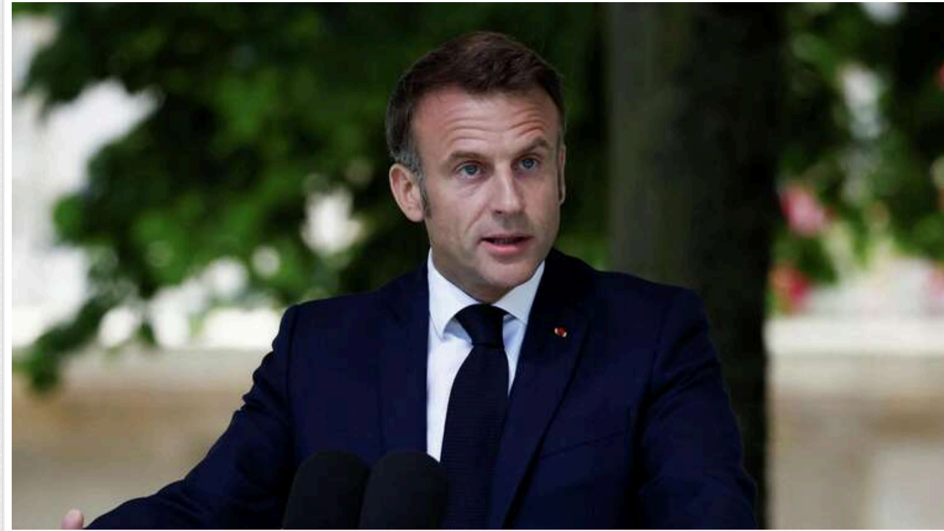
Президент Франції провів розмову з прем'єром Ізраїлю у переддень річниці нападу ХАМАС

Президент Франції Еммануель Макрон у неділю провів розмову з прем'єр-міністром Ізраїлю Біньяміном Нетаньягу – на тлі посилення напруги на Близькому Сході та річниці нападу угруповання ХАМАС на Ізраїль 7 жовтня.