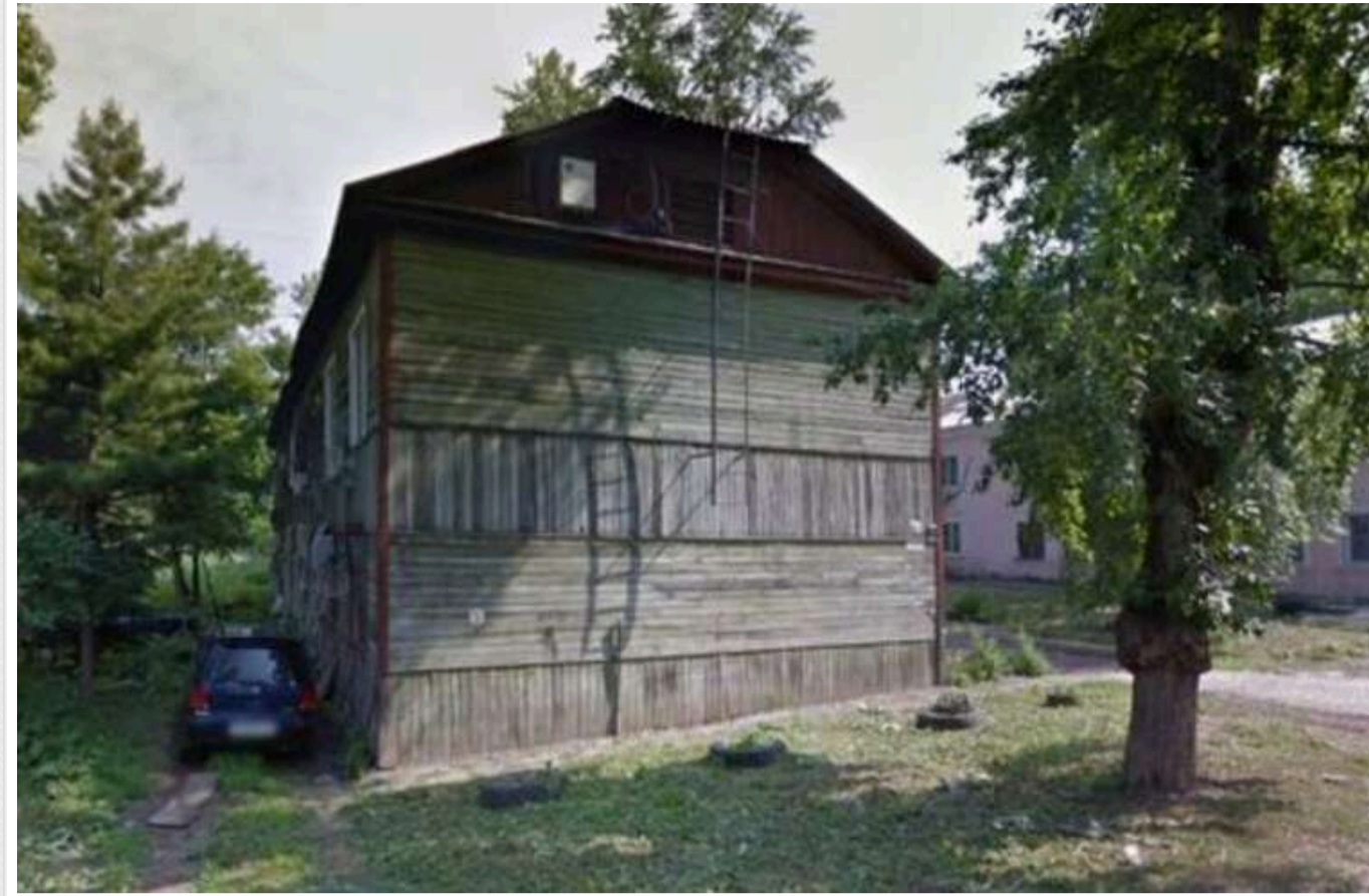
У російському Хабаровську мешканців змушують знести аварійну халупу власним коштом

На вулиці та без грошей опиняться жителі вулиці Серова в Хабаровську.