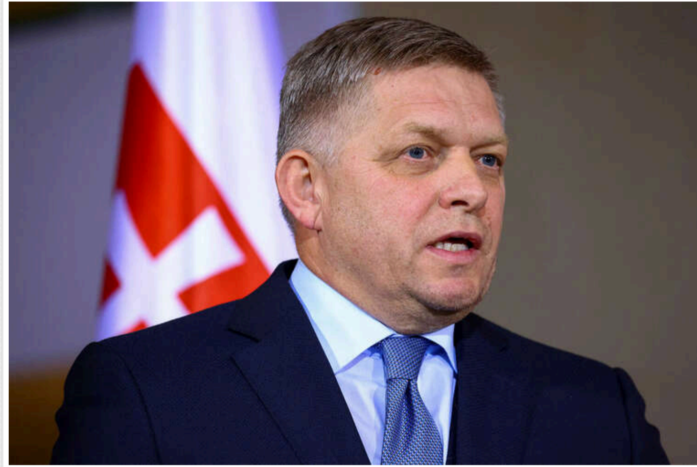
Словацький прем'єр Фіцо звинуватив Захід у затягуванні війни в Україні заради «підкорення росіян»

Прем'єр-міністр Словаччини Роберт Фіцо заявив, що війна в Україні триває нібито лише з тієї причини, що Захід хоче «поставити росіян на коліна».