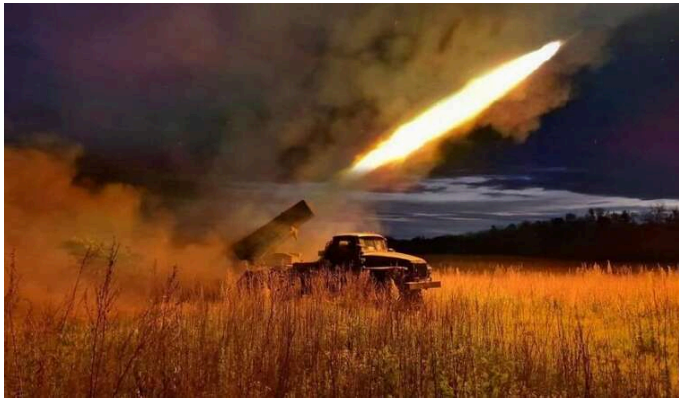
Ситуація на фронті: у Генштабі назвали "найгарячіші" напрямки

Протягом минулої доби зафіксовано 169 бойових зіткнень, зокрема на Куп'янському та Лиманському напрямках противник активно застосовував авіацію.