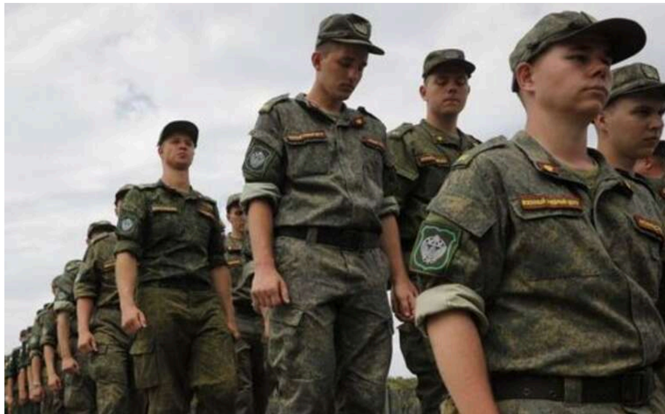
Росія збільшує фінансові стимули для охочих воювати

Російська влада підвищує фінансові стимули для охочих підписати контракт та воювати проти України. Це свідчить про те, що Кремль продовжує покладатися на наявні зусилля з криптомобілізації.