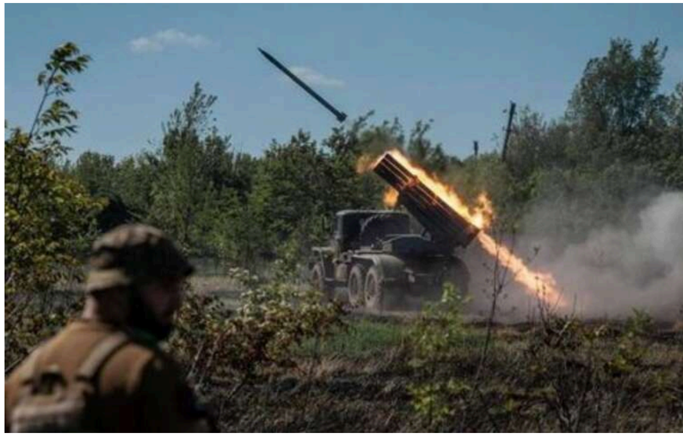
У NYT дослідили переваги та недоліки Росії у битві за Вугледар

До завершення літа російські війська поблизу міста Вугледар Донецької області мали перевагу 10 до 1 в артилерійських системах.