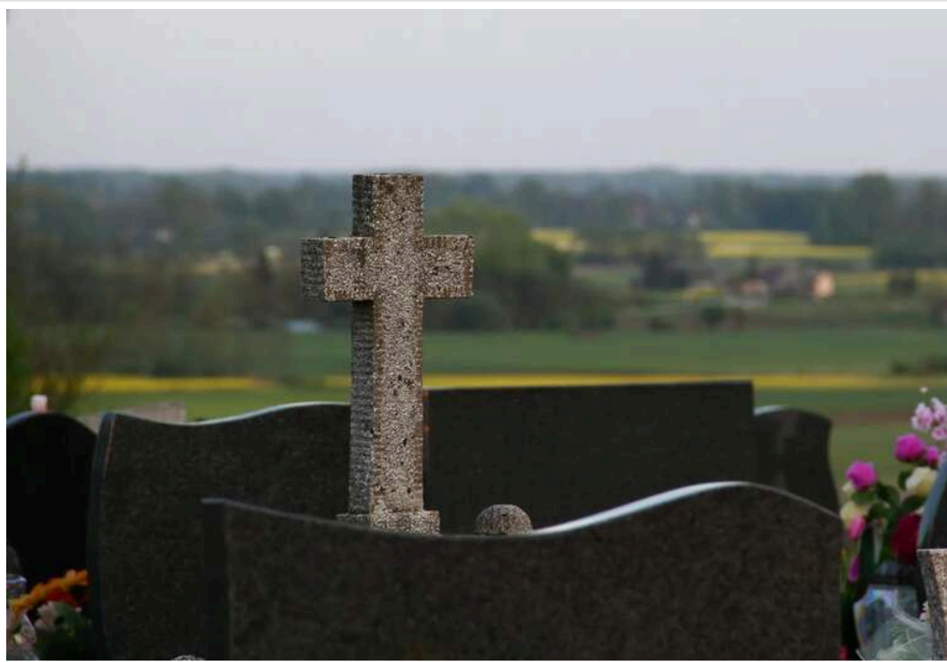
Під окупованим Маріуполем закрили найбільше кладовище через нестачу місць

У Старому Криму російська влада закрила кладовище для поховання маріупольців через брак місць.