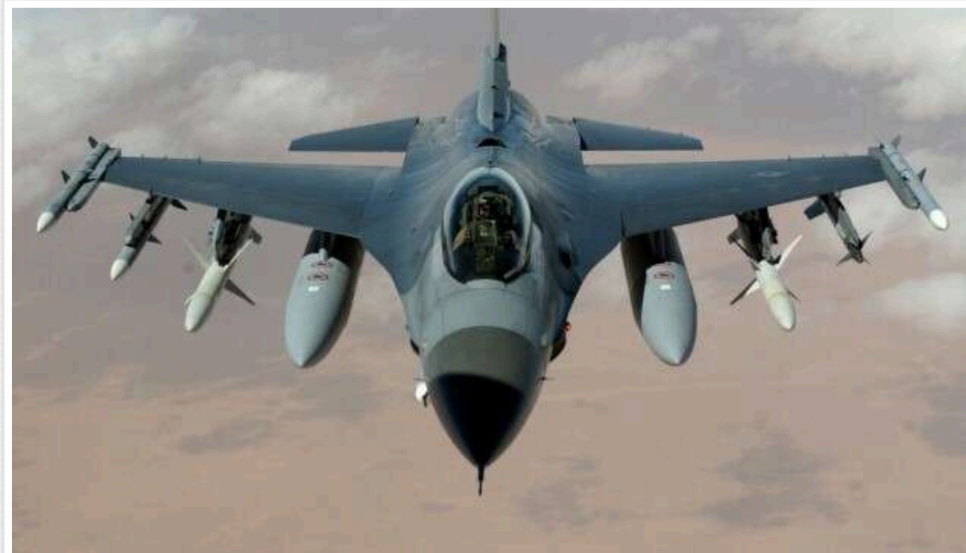
Експерт розповів про проблему з F-16: попередній досвід виявився небезпечним для українських пілотів

Максимально зменшений період навчання на американських винищувачах F-16 у поєднанні з потребою суттєво змінити тактику польотів стали величезним викликом для українських льотчиків і додатковим ризиком у майбутніх екстремальних ситуаціях на полі бою.