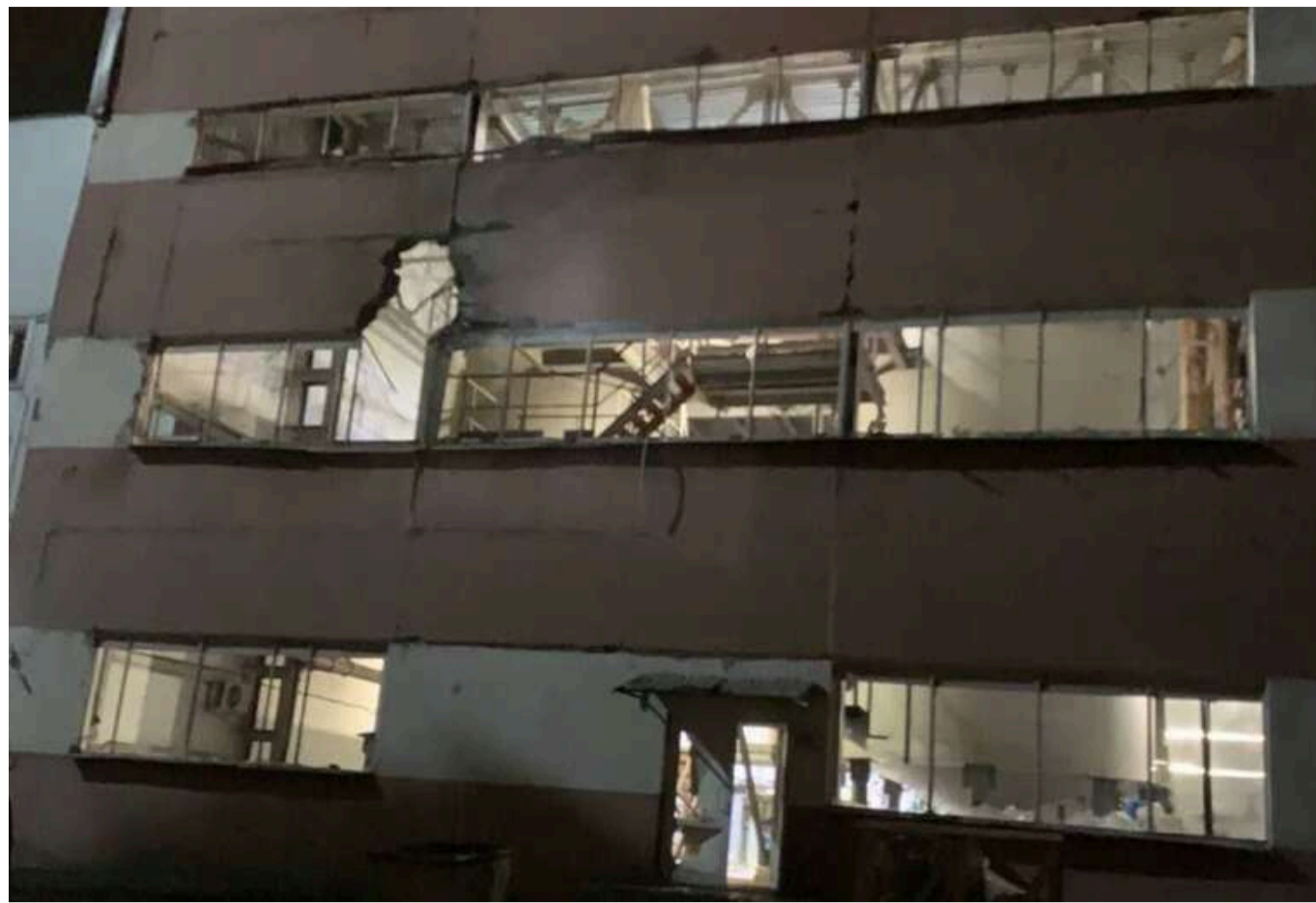
У РФ дрони атакували спиртзавод: ЗСУ влаштували росіянам сухий закон

У ніч проти 5 жовтня у Воронежській області (РФ) було неспокійно – там лунали вибухи. На території були помічені безпілотники, внаслідок чого декілька підприємств зазнали атаки, виникла пожежа.