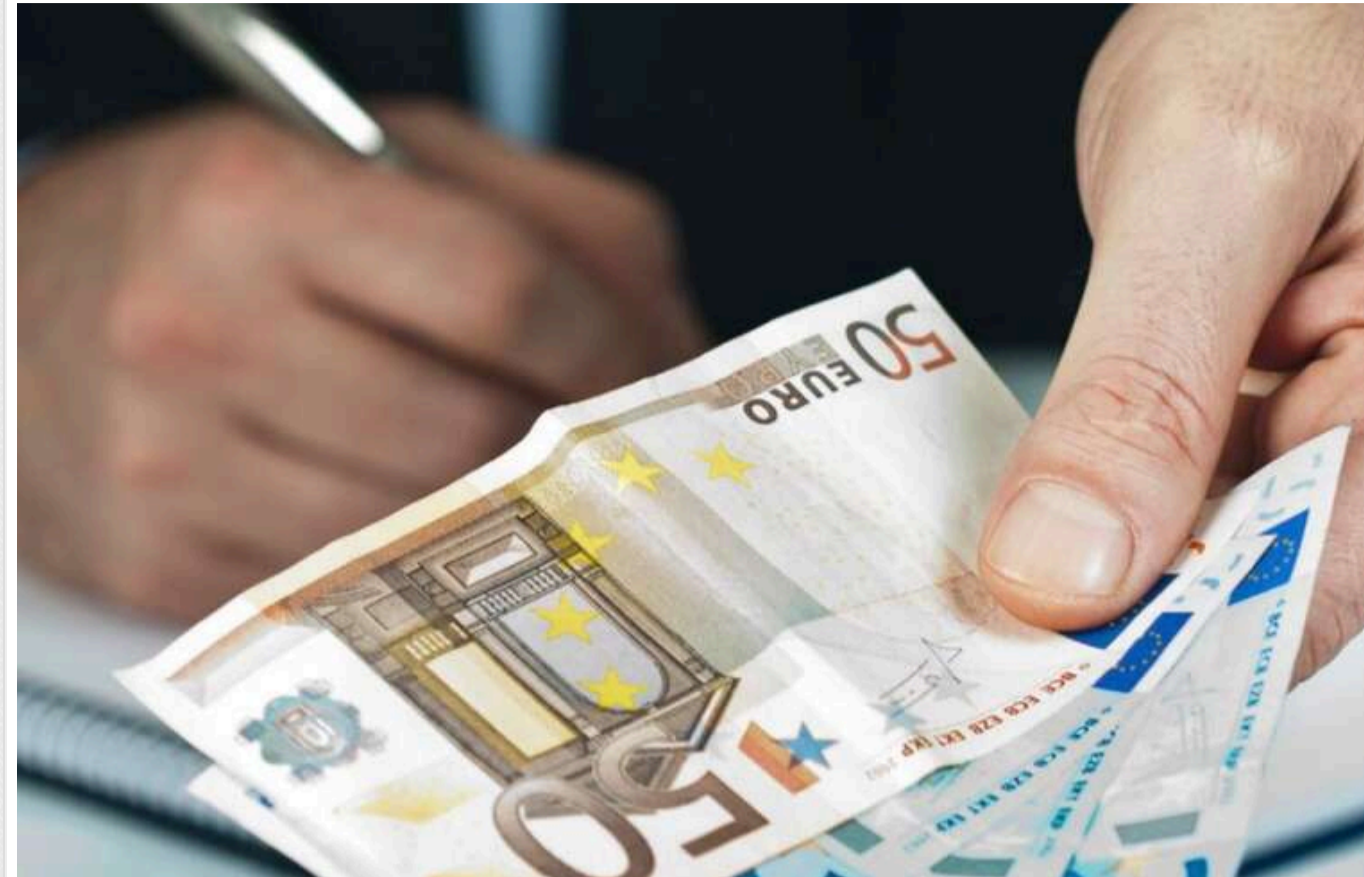
У Німеччині будуть виплачувати по 1000 євро одержувачам допомоги, які пропрацюють рік, – Bild

Німецька влада планує виплачувати по €1000 тим, хто отримувє допомогу і пропрацює мінімум рік.