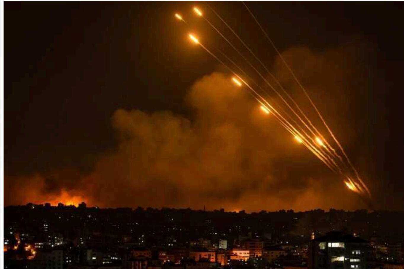
За минулу добу «Хезболла» випустила по Ізраїлю понад 200 снарядів

Протягом доби, 4 жовтня, терористи ліванського угруповання «Хезболла» здійснили атаки на Ізраїль, випустивши сотні снарядів.