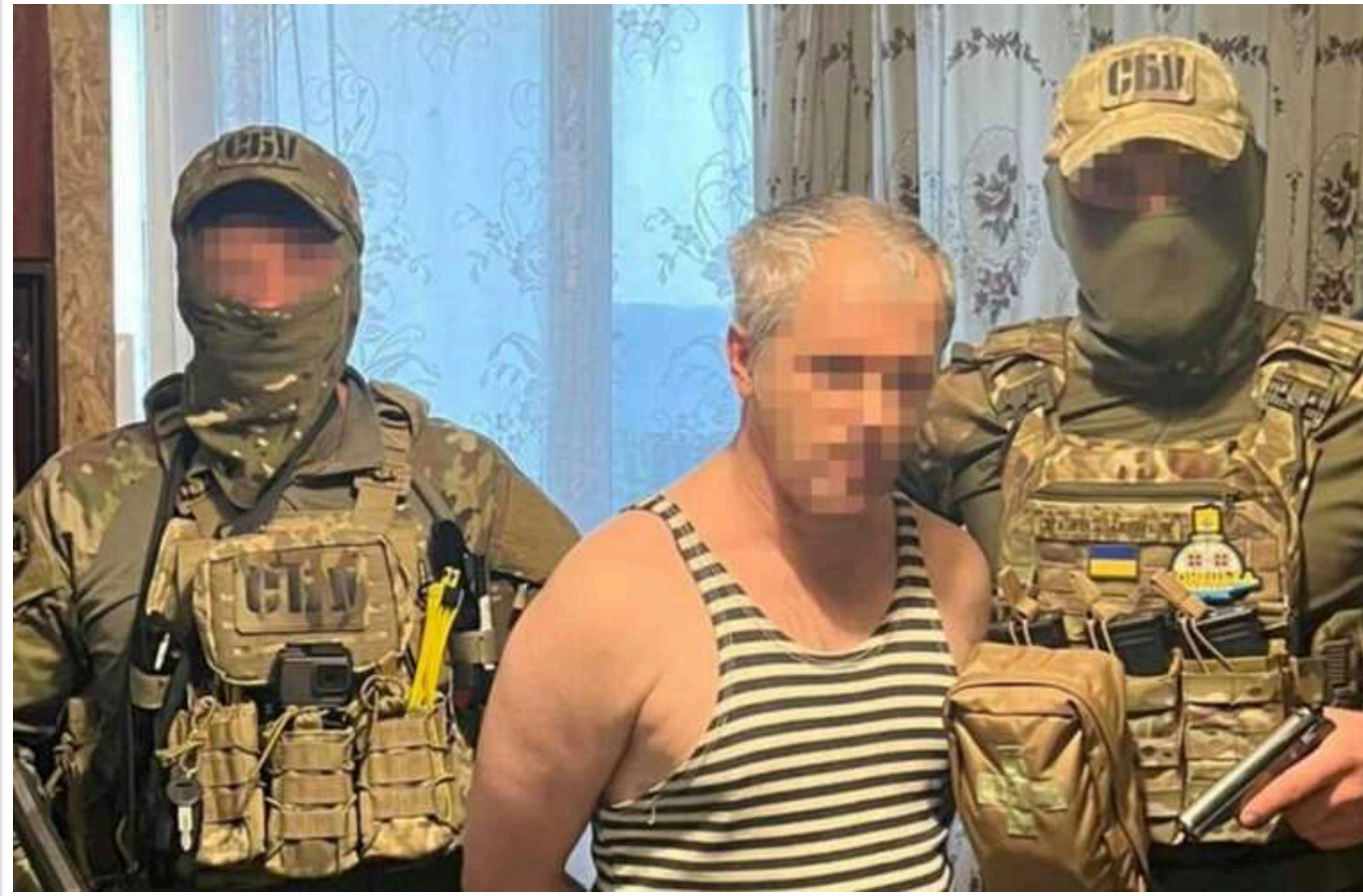
У Донецькій області затримали агента РФ, який передавав інформацію про позиції ЗСУ

Прокуратура арештувала агента ЗС РФ, який передавав ворогу інформацію про укріплення, опорні пункти та блокпости ЗСУ й Нацполіції в Краматорському районі.