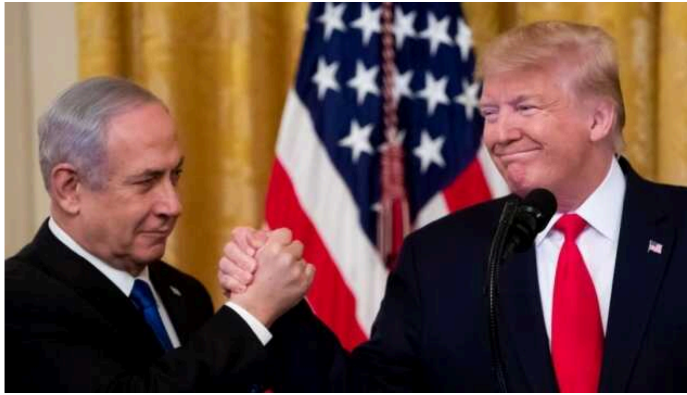
У США демократи підозрюють прем'єра Ізраїлю в намаганні підіграти Трампу

Представники Демократичної партії США вважають, що прем'єр-міністр Ізраїлю Беньямін Нетаньягу намагається впливати на американські вибори, підтримуючи кандидата від республіканців Дональда Трампа.