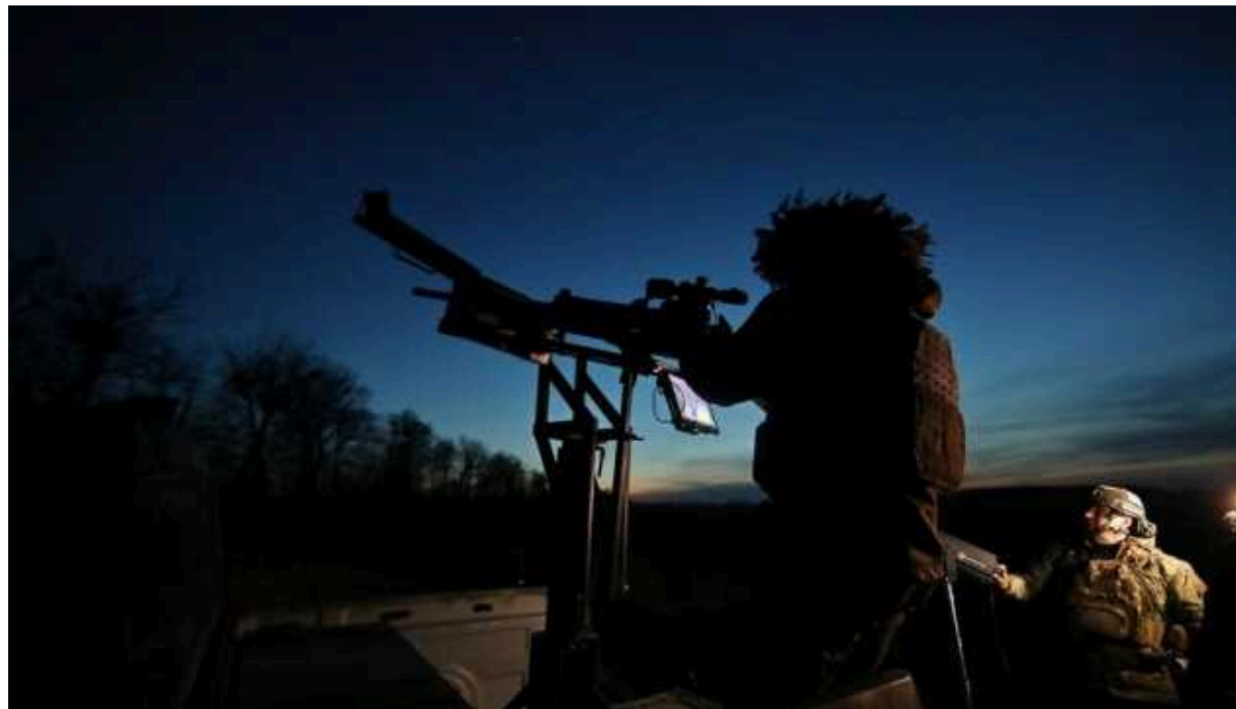
ППО вночі знищила три ворожі «шахеда»

Внаслідок протиповітряного бою було збито 3 ворожих безпілотники в Одеській області. 10 ворожих БПЛА втрачено на півночі та півдні країни, інформація про постраждалих та руйнування не надходила.