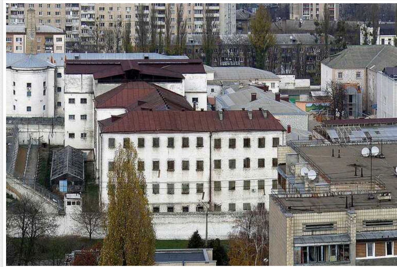
У Лук'янівському СІЗО злочід у законі "Гега Озургетський" освятив "накат" на керівника "Бандерштату"

32-річний уродженець Грузії Поргі Кіладзе, який відомий у статусі так званого злочідя в законі на прізвисько "Гега Озургетський", перебуваючи в застінках "тюрми №1 в Україні", долучився до вирішення питання "вагою" в 50 тис. дол. і дав вказівку отримати відповідні кошти від одного з арештантів установи.