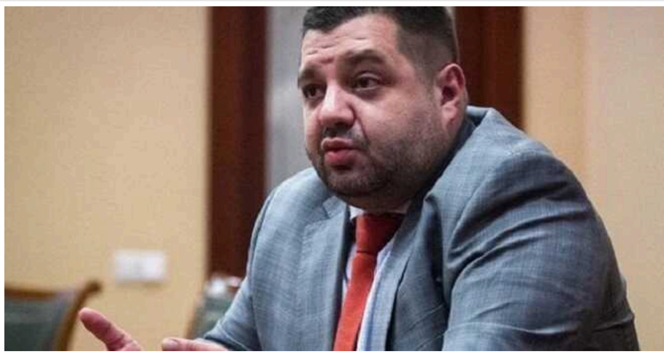
Справа Грановського: НАБУ та САП завершили слідство, фігурант “у бігах”

Національне антикорупційне бюро України (НАБУ) та Спеціалізована антикорупційна прокуратура (САП) завершили розслідування у кримінальному провадженні стосовно масштабної схеми на АТ «Одеський припортовий завод», яка завдала державі мільйонних збитків. Фігурант справи – розшукуваний ексдепутат Київради, колишній народний депутат Олександр Грановський (на фото).