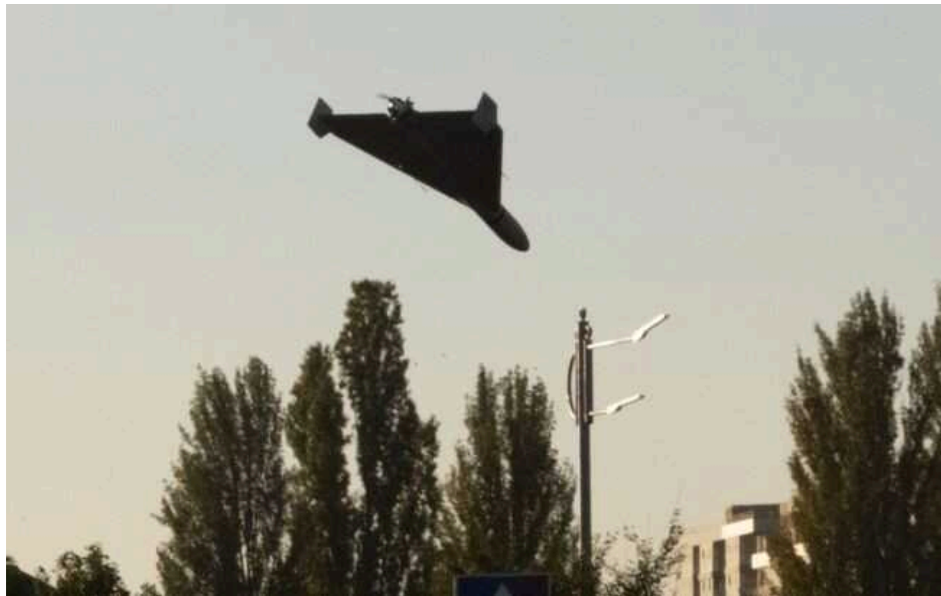
РФ запустила ударні дрони в напрямку України

Російські агресори знову випустили ударні дрони типу "Шахед" у бік України. У кількох областях оголошено повітряну тривогу.