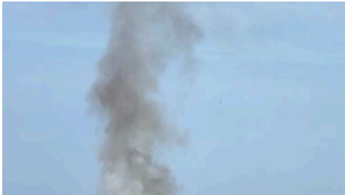
ЗС РФ атакували Запорізьку область, - ОВА

4 жовтня увечері російські військові атакували Запорізьку область, виконавши кілька ударів. Голова ОДА Іван Федоров повідомив, що інформація про руйнування та постраждалих наразі уточнюється.