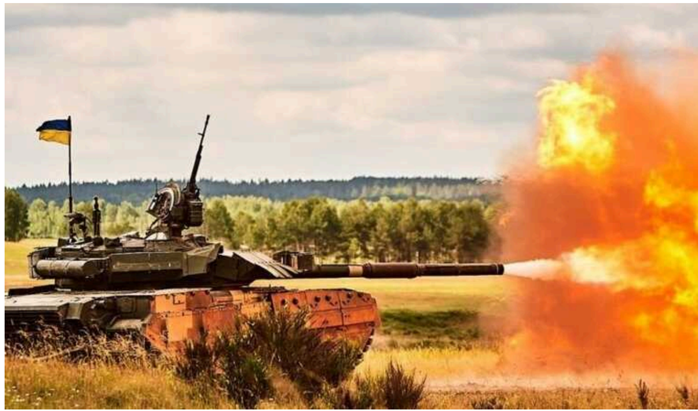
У ЗСУ очікують ускладнення ситуації на Харківщині

Як правило, військовослужбовці РФ вводять "кадировців" у бойові дії, коли готуються до штурмів. Ці підрозділи призначені до виконання ролі загороджувальних сил, щоб окупанти не розбігалися під час бойових дій.