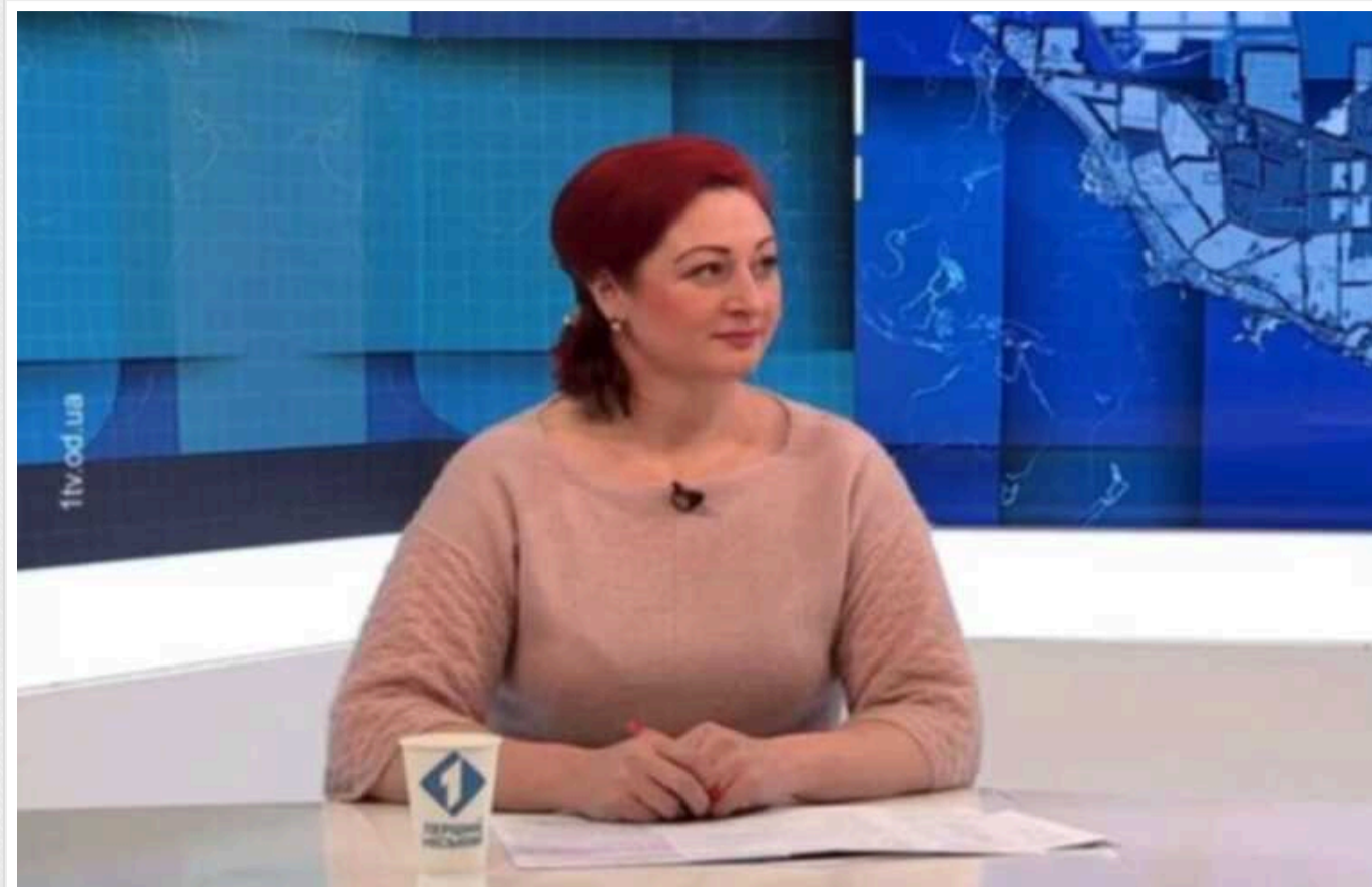
Заступник начальника департаменту аграрної політики Одеської ОВА нахамила водію маршрутки

В одеській маршрутці жінка пропустила свою зупинку і напала на водія, оскільки він не відчинив їй двері.