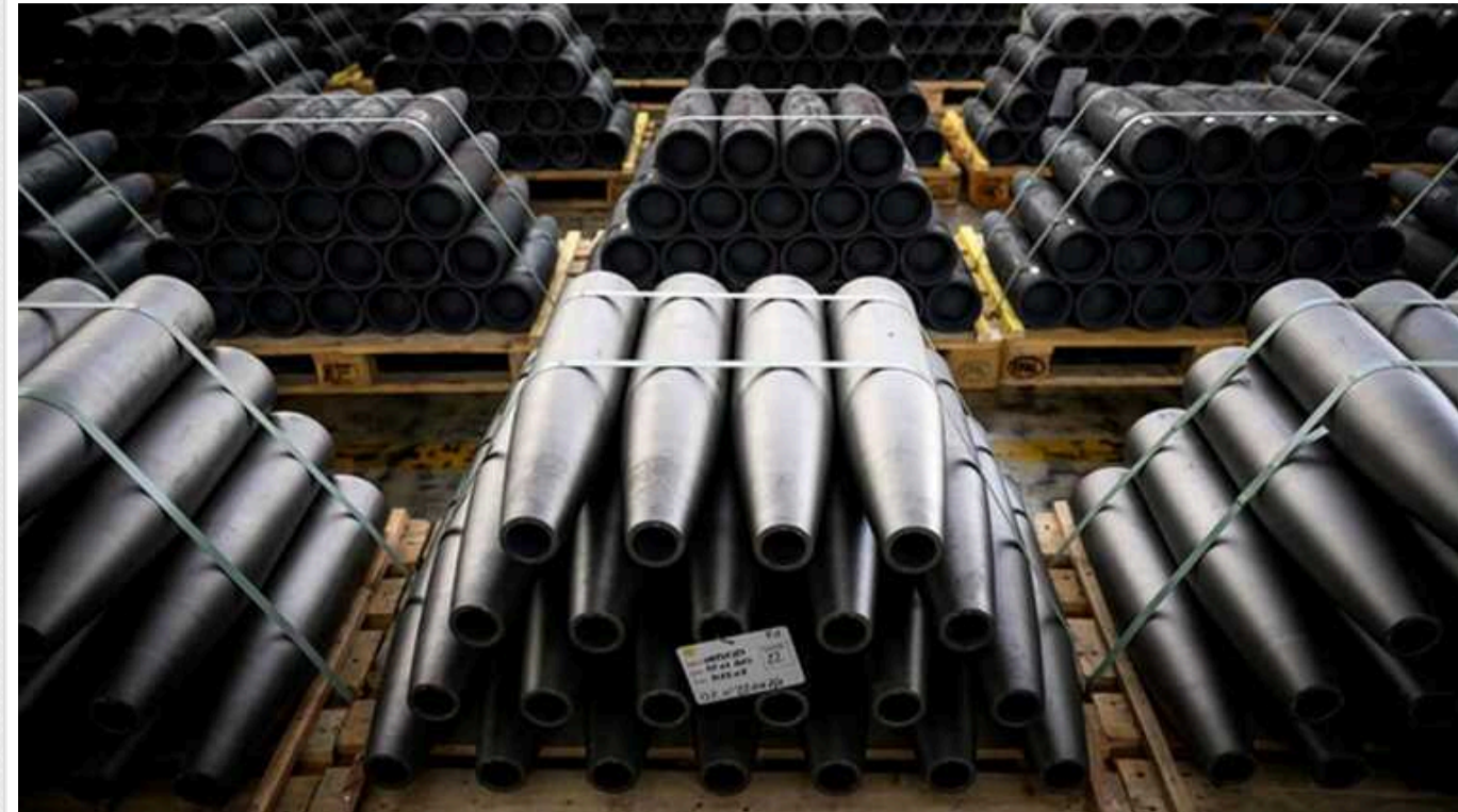
Компанія-спеціалізований імпортер ГУР МО, що повинна була постачати зброю, заборгувала державі понад 800 мільйонів

Компанія-спецімпортер озброєння "Спецтехноекспорт", яка з 2022 року перебуває під контролем Головне управління розвідки Міноборони, уклала договори на купівлю зброї за завищеними цінами, не завжди виконувала мільярдні контракти і наразі накопичила перед державою понад 800 мільйонів гривень боргу – це тільки та сума, яка офіційно визнана судами.