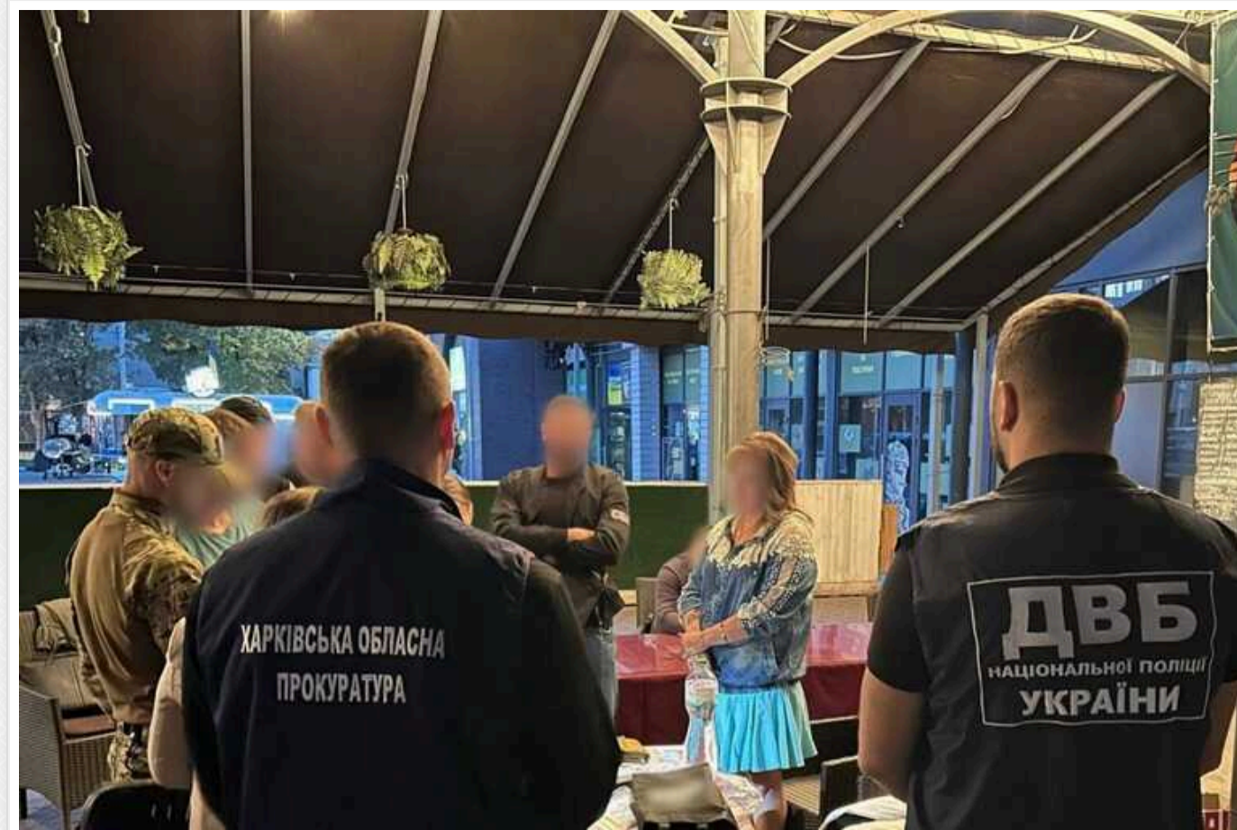
У Харкові затримали жінку, яка допомагала ухилинтам: за 29 тисяч доларів оформляли фальшиву інвалідність

У Харкові затримали жінку, яка за 29 тисяч доларів США допомагала ухилинтам оформити фальшиву інвалідність.