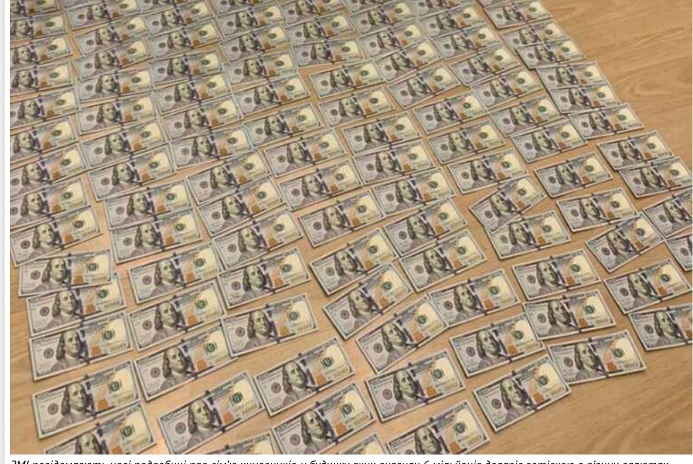
ЗМІ повідомляють нові подробиці про сім'ю чиновників, у будинку яких виявили 6 мільйонів доларів готівкою в різних валютах