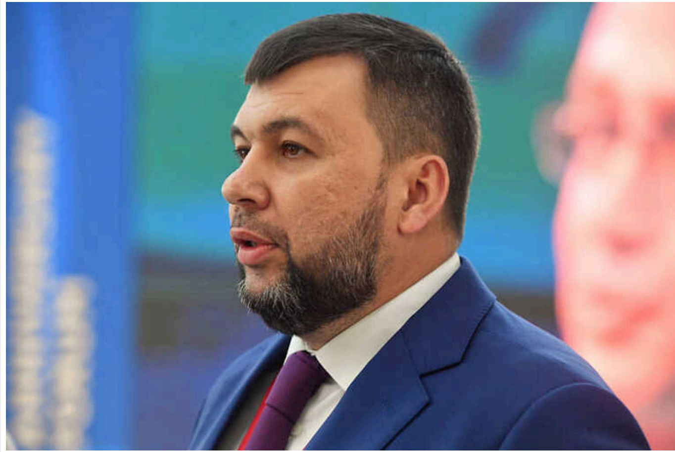
"Голові" ДНР Пушиліну повідомили про нову підозру

Денис Пушилін, ватажок так званої "Донецької Народної Республіки" ("ДНР"), заочно отримав нову підозру в зв'язку з організацією примусової мобілізації громадян для участі у війні проти України. Дії підозрюваного є порушенням вимог Женевської та Гаазької конвенцій.