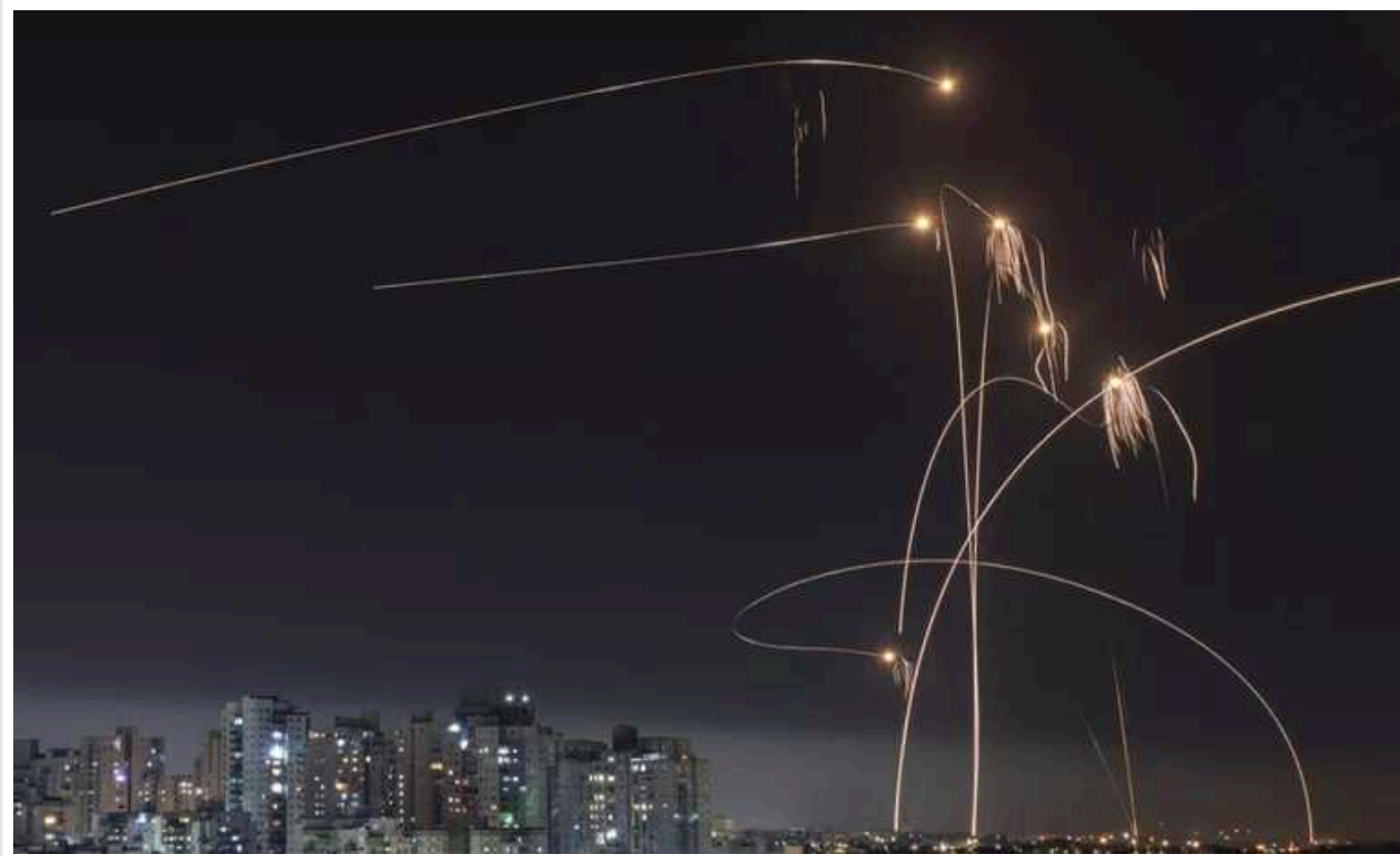
Іранські ракети зуміли пробитися через ізраїльську багаторівневу систему ППО