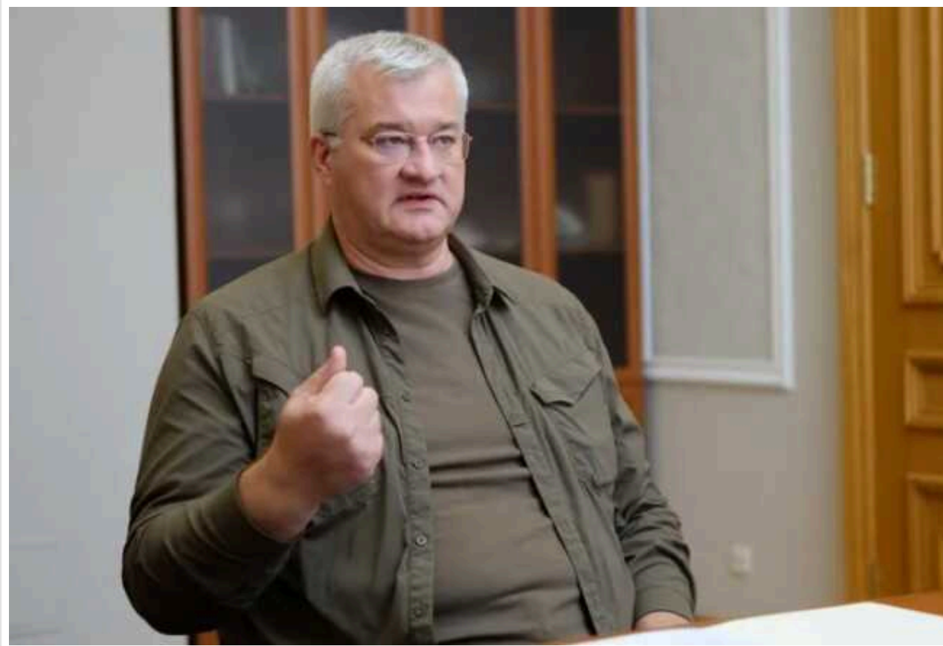
Україна рішує засудила кандидата в президенти МОК через його заяви на підтримку Росії

Міністерство закордонних справ України та Міністерство молоді та спорту України оприлюднили спільну заяву у зв'язку з обурливими коментарями кандидата на пост президента Міжнародного олімпійського комітету (МОК) Хуана Антоніо Самаранча-молодшого. У одному зі своїх недавніх інтерв'ю виданню Le Monde чиновник заявив, що МОК "повинен наполегливо працювати", щоб Росія повернулася до його лав.