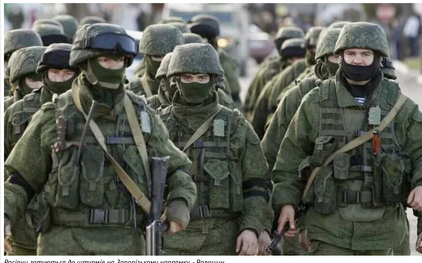
Росіяни готуються до штурмів на Запорізькому напрямку, - Волошин

Російські військові активізують підготовку до штурмових дій на Запорізькому напрямку. Їхньою метою є вихід до адміністративних меж Донецької області та захоплення міста Запоріжжя.