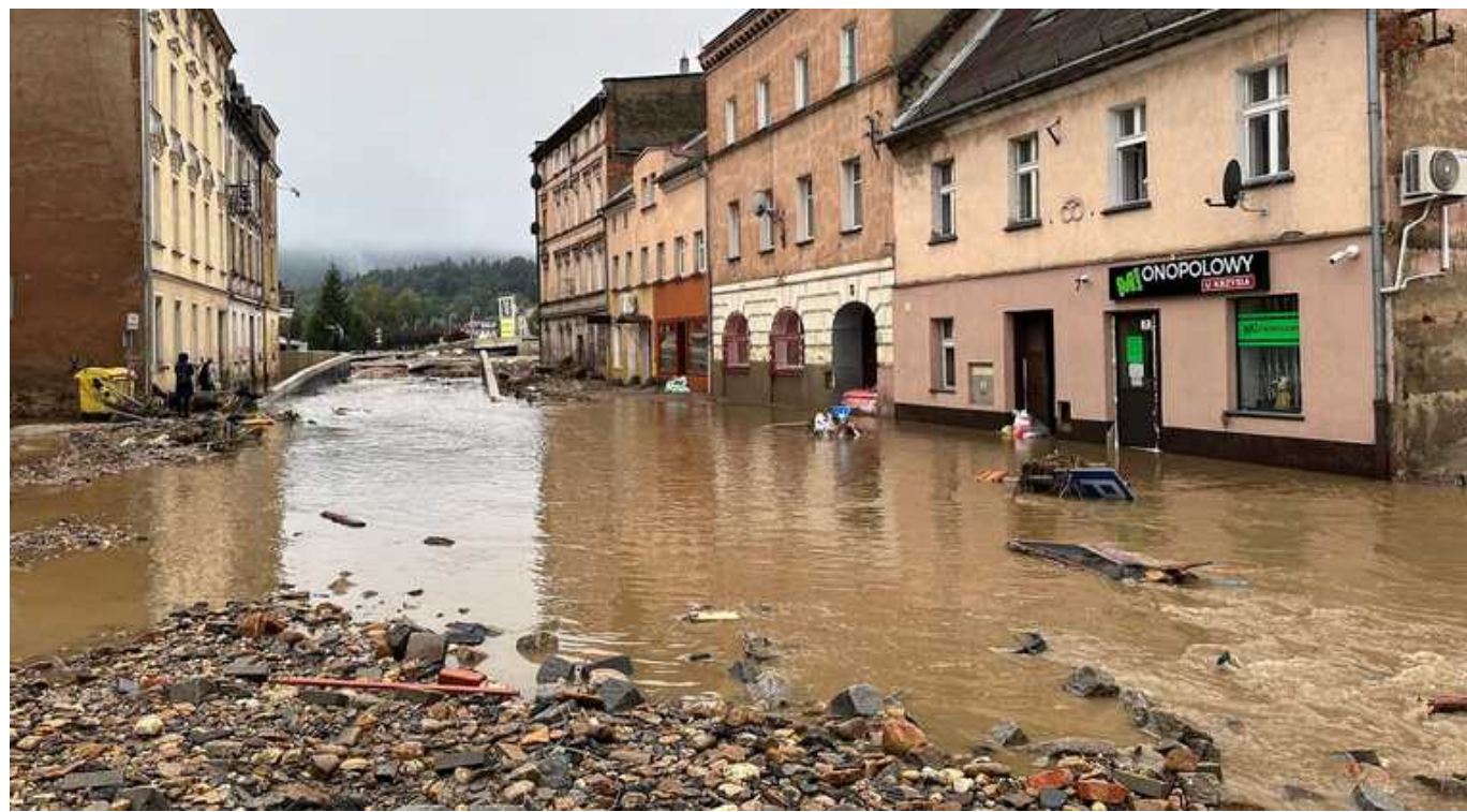
Солдати ЗСУ з 308-го окремого батальйону безпілотників організували збір коштів для постраждалих від повені в Польщі