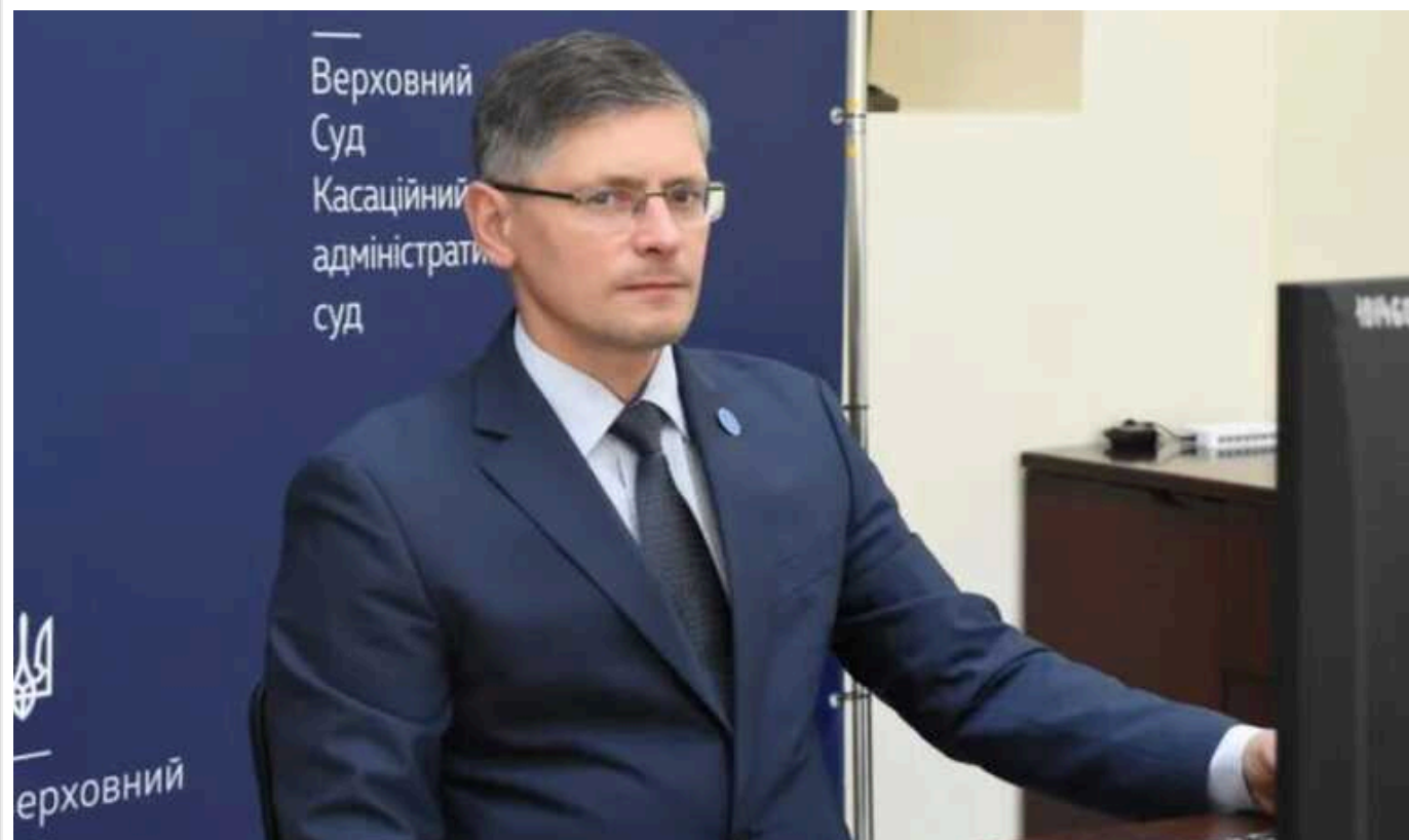
СБУ скасувала судді Верховного суду Кравчуку допуск до державної таємниці

Володимир Кравчук, суддя Касаційного адміністративного суду у складі Верховного Суду та член Ради суддів України, втратив доступ до державної таємниці. З ініціативи Служби безпеки України його відсторонили від розгляду справ фізичних та юридичних осіб, що підпадають під санкції.