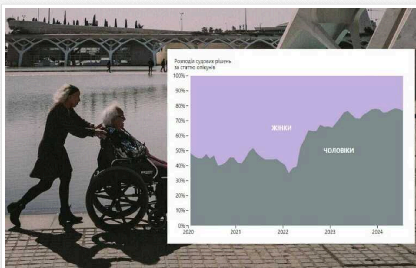
80% опікунів в Україні – військовозобов'язані чоловіки, - ЗМІ

В Україні безпрецедентно зростає кількість випадків визнання осіб недієздатними та призначення їм опікунів.