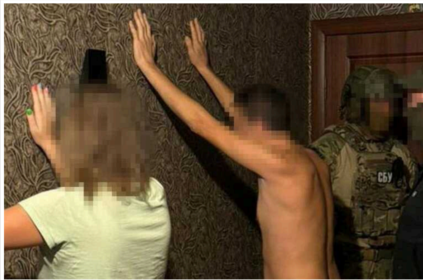
У Дніпрі затримали подружжя, яке шпигувало за українською ППО та підпалювало об'єкти "Укрзалізниці"

Контррозвідка Служби безпеки затримала в Дніпрі двох агентів ФСБ, які передавали загарбникам інформацію про локації української протиповітряної оборони та вчинили підпали на "Укрзалізниці".