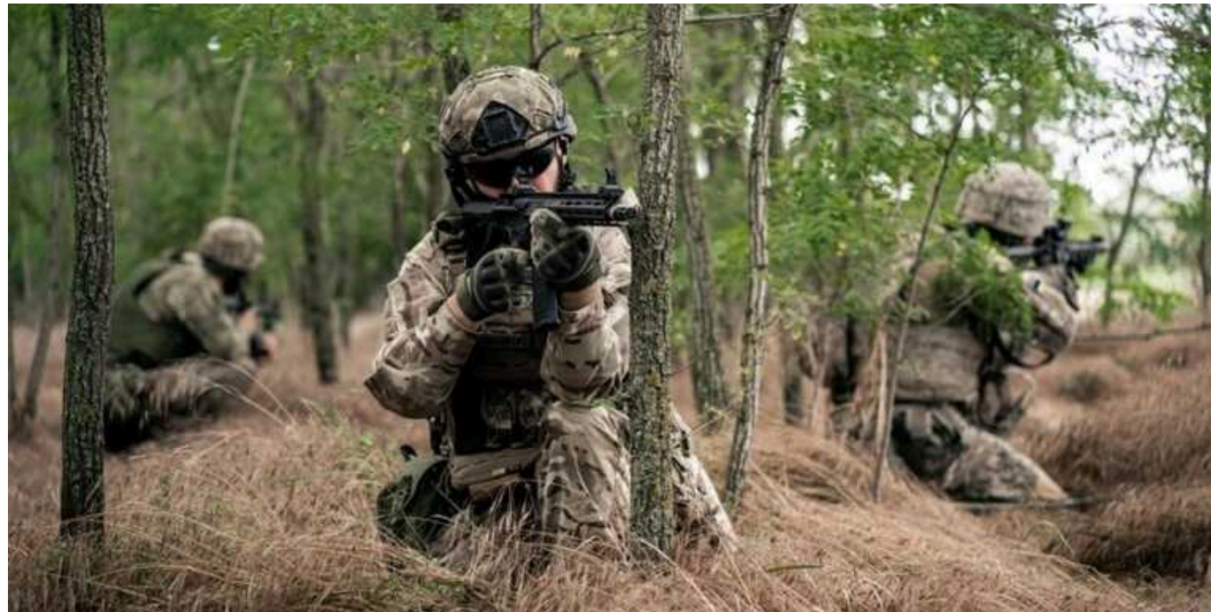
Військовий ЗСУ висловлює своє невдоволення командуванням через запізніле виведення військ з Вугледара

Лейтенант ЗСУ з позивним "Алекс" висловлює невдоволення командуванням через запізніле виведення військ з Вугледара.