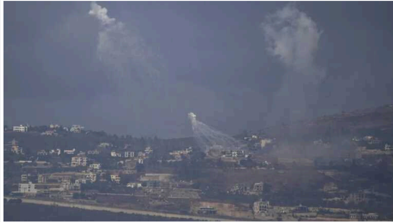
Іран вирішив атакувати Ізраїль, бо стримана політика може бути розцінена як слабкість

Іран зважився на атаку на Ізраїль, оскільки раніше стримана політика Тегерана тепер може бути розцінена як слабкість.