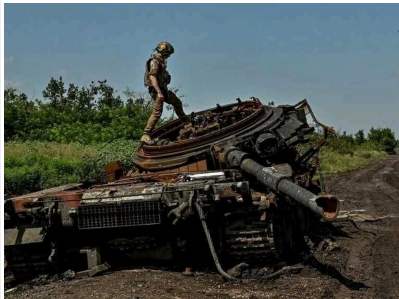
Втрати ворога за добу: відмінували 1130 окупантів, 32 ББМ і 14 артсистем

Вчора, 1 жовтня, Сили оборони знищили 1130 російських окупантів. Також було знищено 151 одиницю військової техніки та озброєнь ворога.