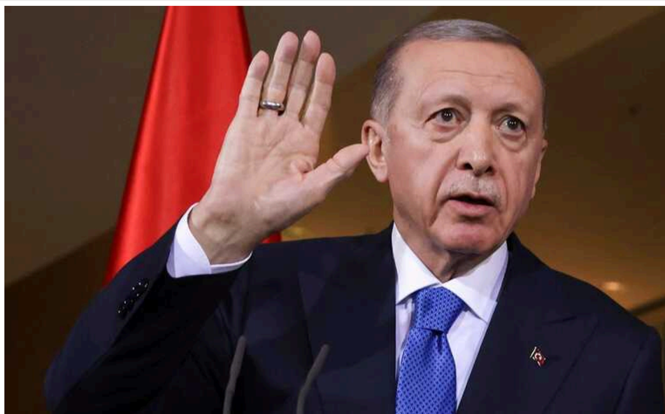
Ердоган: Туреччина може стати наступною ціллю Ізраїлю

Президент Туреччини звинуватив Ізраїль у геноциді в Газі та попередив про наслідки операції в Лівані.