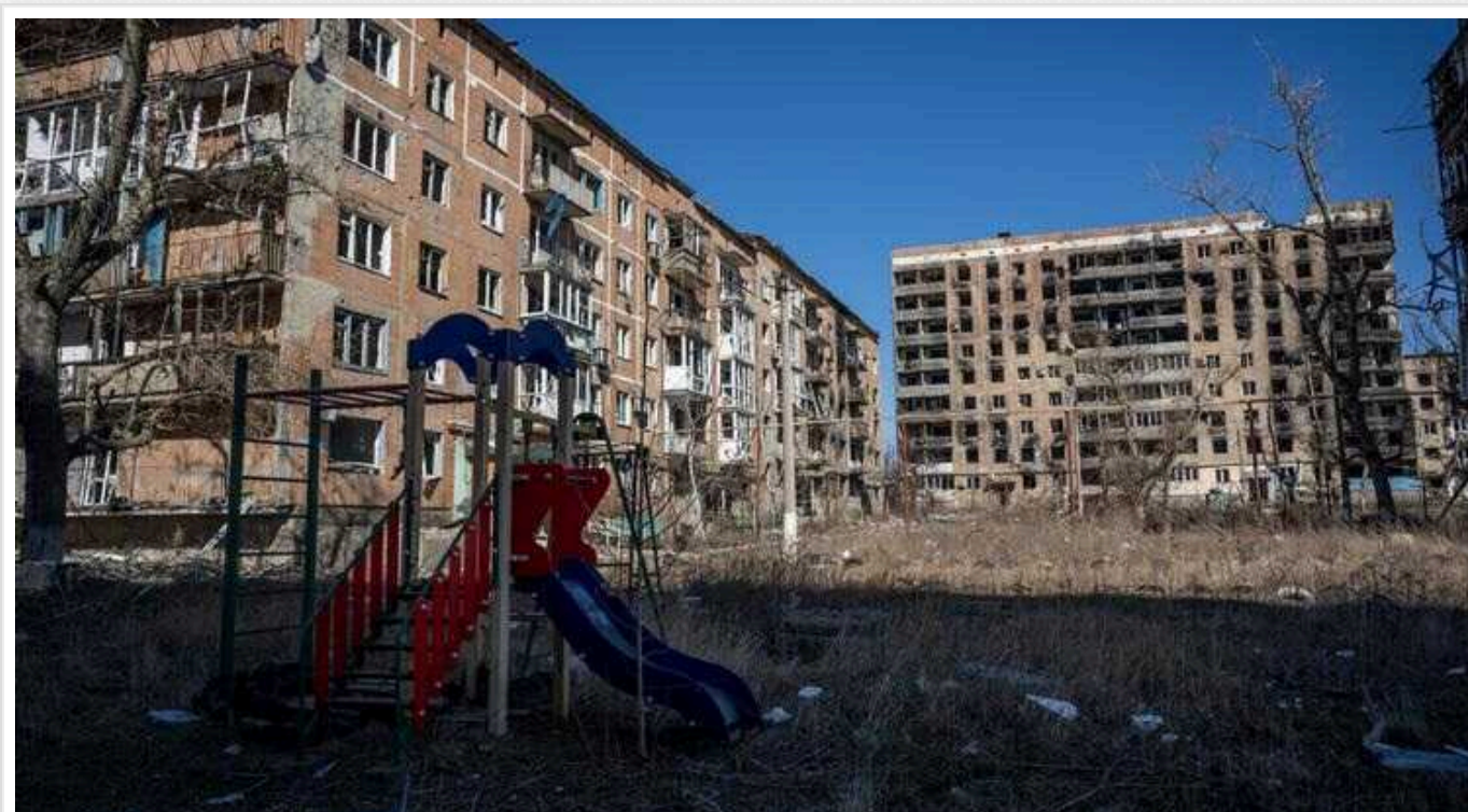
В ISW оцінили, чи здатні окупанти на швидке просування у Вугледарі: бої за місто коштували Росії колосальних втрат

1 жовтня з'явилася інформація про можливе захоплення російськими військами міста Вугледар. Окупанти вивішують на будівлях російські триколори, а пропагандисти РФ стверджують, що оборонці міста нібито зазнали значних втрат. Також з'явилася інформація про можливий відхід українських сил.