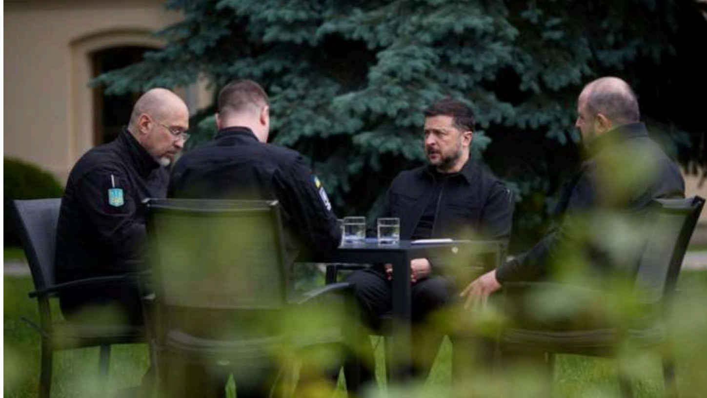
Фото: Зеленський, Буданов, Умеров, Шмигаль

Президент України Володимир Зеленський повідомив , що провів «спеціальну нараду» за участю керівника Офісу Президента Кирила Буданова, секретаря РНБО Рустема Умерова та міністра енергетики Дениса Шмигала.