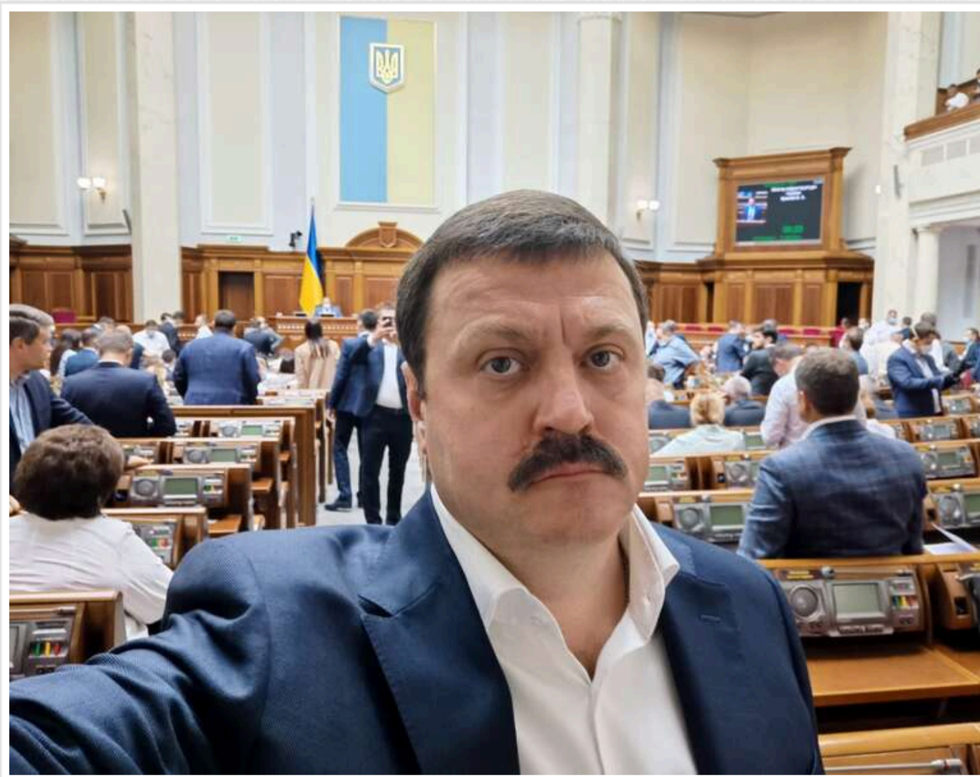
Герой Росії та сенатор у Москві: ВАКС несподівано зняв арешт із валюти в справі про держзраду екснардепа Деркача

Поки колишній народний депутат Андрій Деркач буде новою політичною кар'єру в Росії та носить звання Героя Росії, українська судова система демонструє несподівані рішення навколо однієї з найгучніших справ про державну зраду.