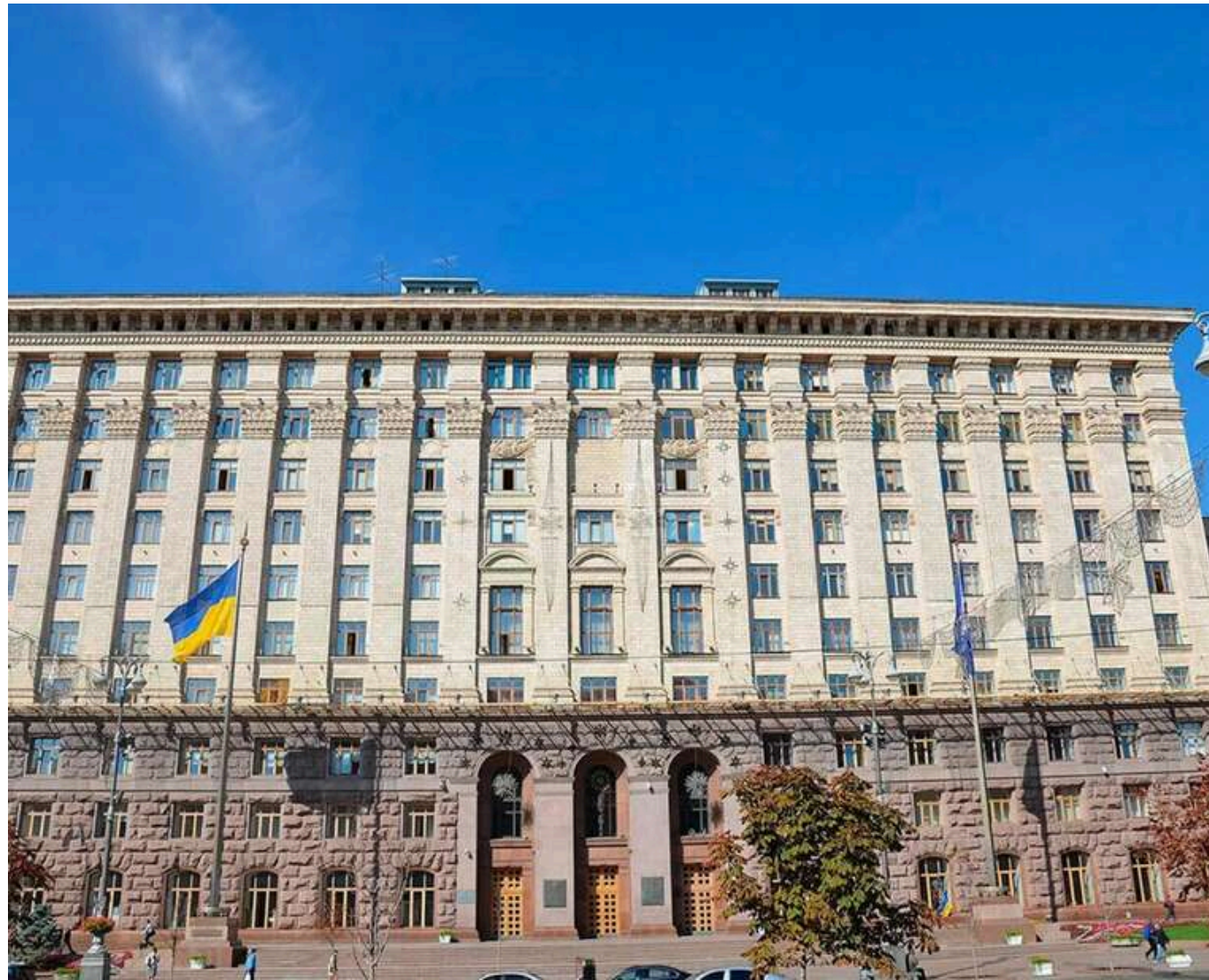
Корупційна історія на Хрещатику: У Київradі намагалися в обхід правил повернути схеми з приватизації нерухомості

У Київradі спалахнув скандал через спробу скасувати Антикорупційні земельні правила, ухвалені депутатами ще в жовтні 2025 року. Високопосадовець КМДА, відповідальний за приватизацію та корпоративні права в Департаменті комунальної власності, намагався протягнути зміни, які фактично нівелюють ці правила, «всунувши» свою правку до іншого проекту, не пов'язаного з антикорупційною тематикою. Депутати підтримали рішення, а після переговорів Віталій Кличко нібито погодився накласти вето, однак є побоювання, що цього може й не відбутися.