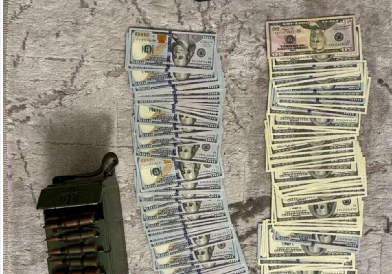
Схеми на 700 тисяч доларів: на Буковині викрили мережу втечі за кордон, куди входили депутат та поліцейський

У Чернівецькій області викрили масштабну схему незаконного переправлення чоловіків через державний кордон, яку організували десятеро осіб. Серед фігурантів – депутат та працівник поліції.