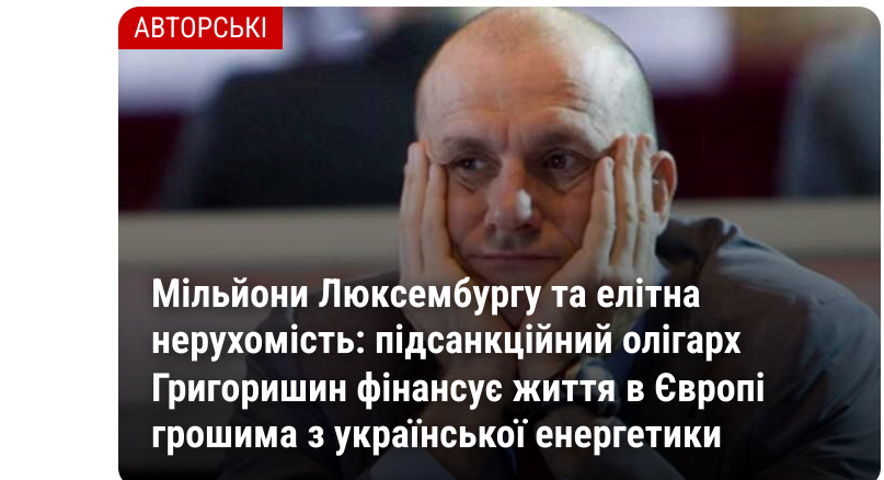
АВТОРСЬКІ Мільйони Люксембургу та елітна нерухомість: підсанкційний олігарх Григоришин фінансує життя в Європі грошима з української енергетики