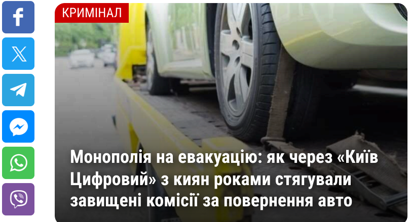
КРИМІНАЛ Монополія на евакуацію: як через «Київ Цифровий» з киян роками стягували завищені комісії за повернення авто