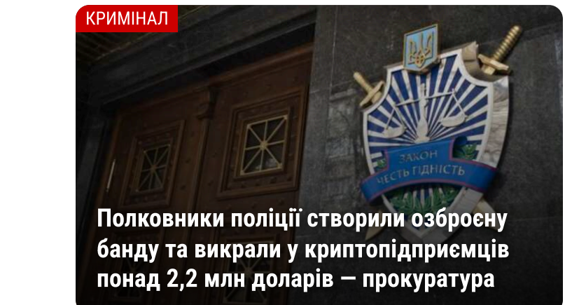
КРИМІНАЛ Полковники поліції створили озброєну банду та викрали у криптопідприємців понад 2,2 млн доларів – прокуратура