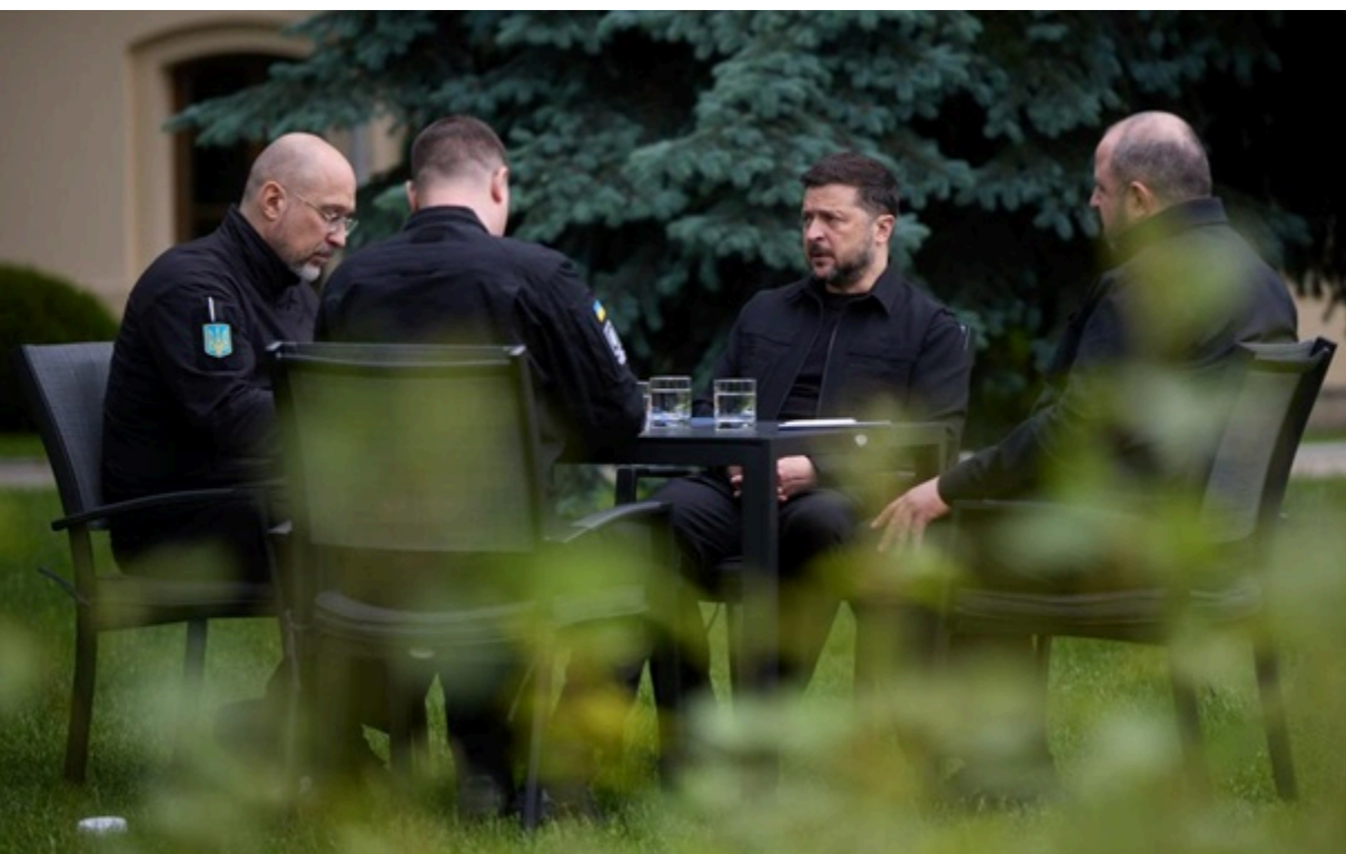
Зеленський зібрав на нараду Буданова, Умерова і Шмигала

Глава держави відмовився від публічних деталей, але серед пріоритетів антибалістика, двосторонні документи щодо виробництва і постачання дронів, зокрема Drone Deal з ЄС, та підготовка зустрічей в кількох форматах.