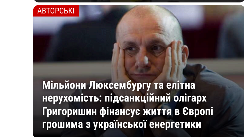
Мільйони Люксембургу та елітна нерухомість: підсанкційний олігарх Григоришин фінансує життя в Європі грошима з української енергетики