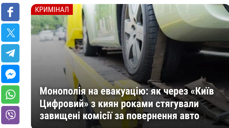
Монополія на евакуацію: як через «Київ Цифровий» з киян роками стягували завищені комісії за повернення авто