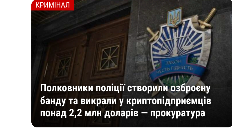
Полковники поліції створили озброєну банду та викрали у криптопідприємців понад 2,2 млн доларів – прокуратура